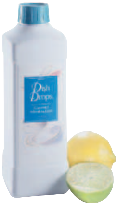
Best.-Nr. 0228 – 1 Liter

Aufgrund ihrer hochkonzentrierten Zusammensetzung und leichten Wasserlöslichkeit sind unsere Produkte mit vielen anderen Produkten auf dem Markt nicht vergleichbar. Unsere Konzentrate für die Geschirrpfleger wurden für die individuelle Verwendung und sparsamen Verbrauch entwickelt und bieten neben patentierten Formeln noch viele andere Vorteile.