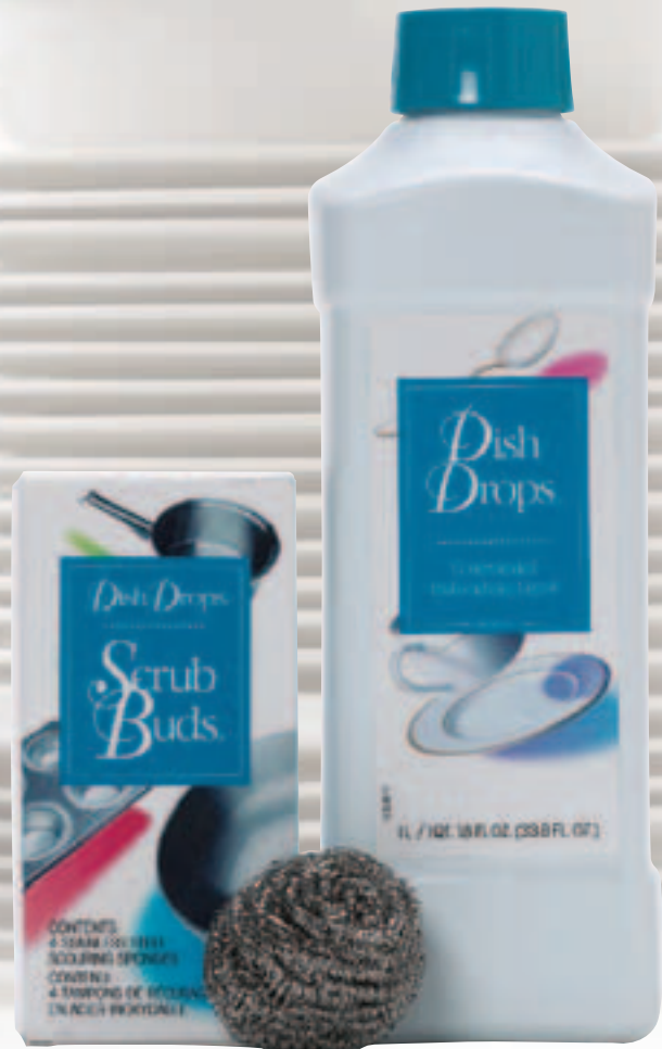
Best.-Nr. 6407 – Packung mit 4 Stück